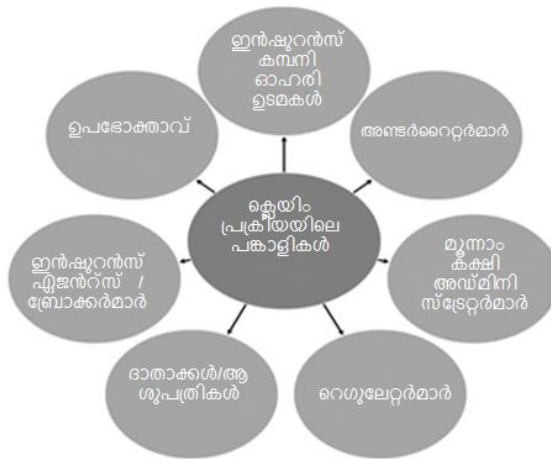
ഡയഗ്രാം 1: ക്ലെയിം പ്രക്രിയയിൽ പങ്കാളികൾ

ക്ലെയിമുകൾ എങ്ങനെ കൈകാര്യം ചെയ്യപ്പെടുന്നു എന്ന് നോക്കുന്നതിന് മുമ്പ്, ക്ലെയിം പ്രക്രിയയിൽ താൽപ്പര്യമുള്ള കക്ഷികളെ മനസ്സിലാക്കേണ്ടതുണ്ട്.